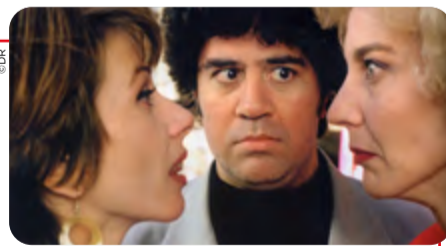
Talons Aiguilles, 1991

Marisa Paredes, une des actrices fétiches de Pedro Almodovar est à l'honneur lors de cette 15 e édition. Une belle occasion pour tester vos connaissances sur l'œuvre du cinéaste espagnol, Prix Lumière en 2014. — par Laura Lépine