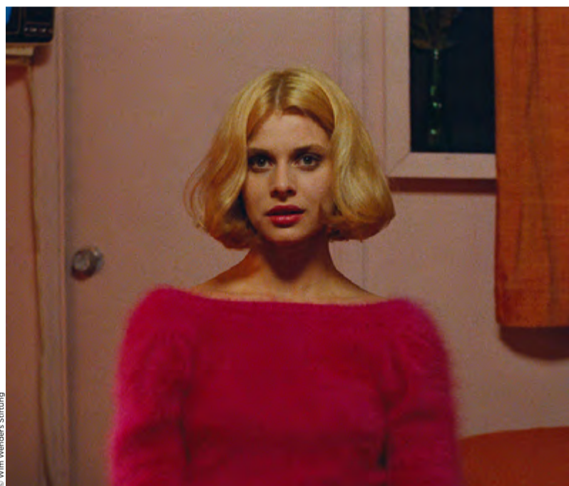
Paris, Texas, 1984

Juste avant publication, Sam Shepard dont Wenders admire le travail et à qui il aurait aimé donner de rôle principal de Hammett , lui a envoyé le manuscrit de Motel chronicles . Le cinéaste est enthousiaste, il sent qu'il tient là ce qui pourrait être son premier « vrai » film américain, celui dont il rêvait depuis la vieille Europe. Il prend des notes pour un scénario,