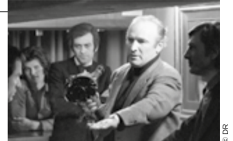
Valerio Zurlini peintre des sentiments, 2023