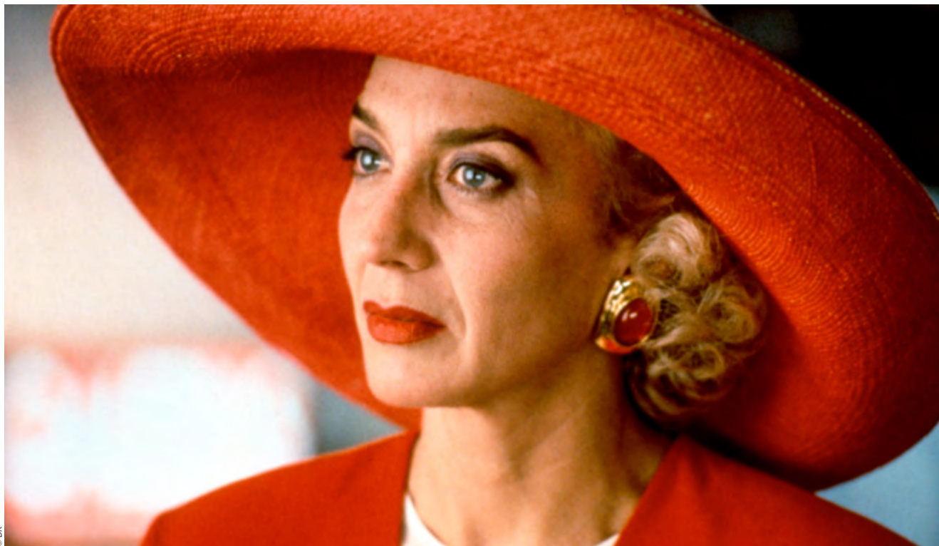
Talons Aiguilles, 1991