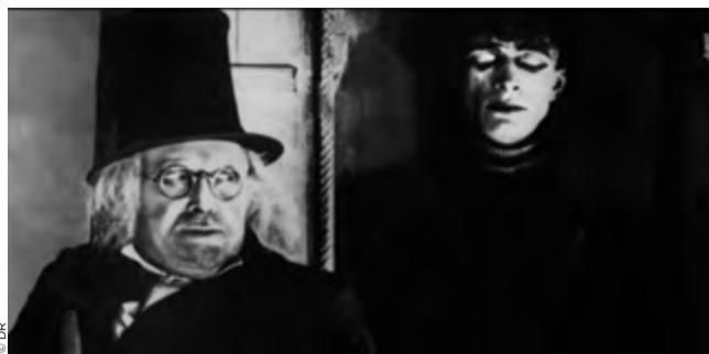
Le Cabinet du docteur Caligari, 1920

Des questions, Le Cabinet du docteur Caligari (1920) en a beaucoup soulevées : peut-on qualifier d'expressionniste un film au décors hallucinés (signés Walter Reimann, Walter Röhrig et Hermann Warm) mais à la mise en scène plutôt frontale ? Qui est le véritable auteur d'une œuvre dont tous les concepteurs, exilés aux États-Unis pour fuir le nazisme, cherchaient à s'attribuer la paternité ? Enfin, comme le soutint l'historien Siegfried Kracauer dans un livre célèbre, le pouvoir hypnotique de Caligari sur sa victime transformée en meurtrier annonce-t-il le pouvoir hitlérien ? Quelles que soient les réponses (oui, son réalisateur Robert Wiene et en un sens, selon l'auteur de ces lignes), cette fable horrifique n'a rien perdu de sa puissance. Au contraire, dans la belle restauration présentée par la fondation Murnau, on est frappé par la présence physique des acteurs, le maquillage épais de Conrad Veidt comme un comédien arpentant la scène de la Schaubühne. Ils ont tourné ce film il y a plus de cent ans dans un studio berlinois, ils sont là sous nos yeux. — A. F.