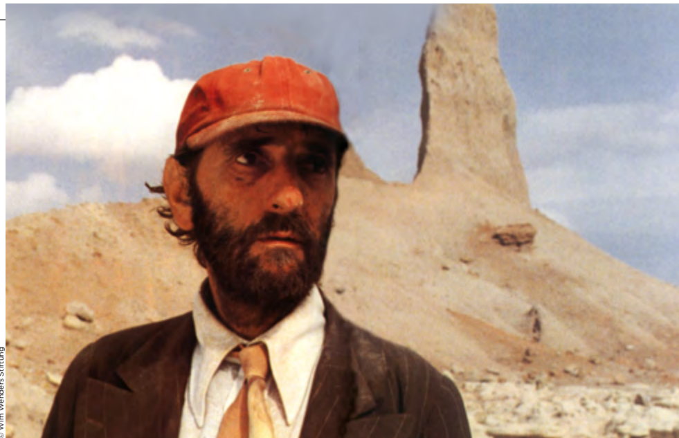
Paris, Texas, 1984

Là encore, chaleur accablante : le peep show a été construit à Port Arthur, Texas, une ville dont Wenders connaît l'existence