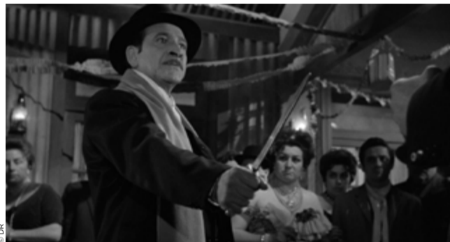
L'Homme au coin du mur rose, 1962

Chaque jour un cinéaste méconnu et un film à redécouvrir : rendre justice aux oubliés de l'histoire du cinéma, c'est aussi le rôle du festival Lumière.