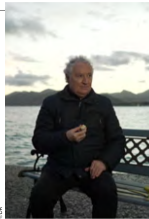
Bande de ringards, 2023

LES MOMENTS FORTS : Les souvenirs et fines analyses de José Garcia, son partenaire dans La Vérité si je mens 2 ; une étonnante archive du Petit conservatoire de Mireille , une émission de télé du temps jadis (on précise pour les plus jeunes), où le jeune Daniel Prévost se rêvait chanteur à textes (surréalistes) ; une confession comme en passant : avoir été malheureux au Petit Rapporteur (une émission à peine plus récente), et à cause de Jacques Martin, là où, pourtant, beaucoup d'entre nous l'ont découvert... — A. F.