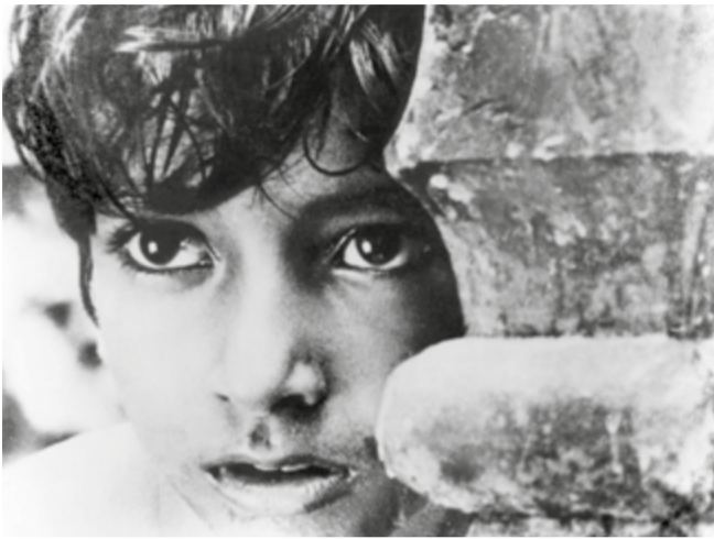
Pather Panchali, 1955