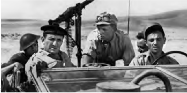
Un taxi pour Tobrouk : la «Pat'» patrouille version 1961