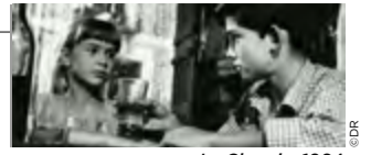
Le Chemin, 1964

Le Chemin est la chronique de la vie dans un petit village du fin fond de l'Espagne des années 50. Tous les âges et toutes les typologies humaines y sont représentés. Tous les espoirs aussi. Entre la religion confondue avec la superstition, les femmes seules, prêtes à tout pour se sentir exister, et les parents affairés à gagner leur vie, les enfants circulent intensément, jouent, cherchent à prolonger le plus longtemps possible la légèreté de leur âge. La réalisatrice Ana Mariscal (1923-1995), grande redécouverte du festival Lumière 2023, multiplie les saynètes avec humour et rythme soutenu.