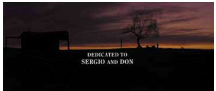
À la fin de Impitoyable , Clint Eastwood dédicace son film à Sergio Leone et Don Siegel

L'Ina et les Archives municipales de Lyon s'associent pour valoriser la conservation de la mémoire sous toutes ses formes. En 2009, les Rendez-vous avec l'Ina font découvrir les trésors singuliers, parfois inédits, des films produits par l'Ina depuis 30 ans. Pour faire écho au festival Lumière 2009, un programme autour du cinéma de Sergio Leone et de Clint Eastwood sera proposé. Mercredi 7 octobre à 18h30 : Le Western avec Sergio Leone de Georges Paumier (1973, 26min) suivi de Hollywood USA : Clint Eastwood de Michel Minaud (1978, 34min, Collection Ciné regards). Projections aux Archives municipales de Lyon, 1 place des Archives, Lyon 2 ème . Entrée libre dans la limite des places disponibles (sans billet). Renseignements au 04 72 83 80 50 ou www.ina-entreprise.com .