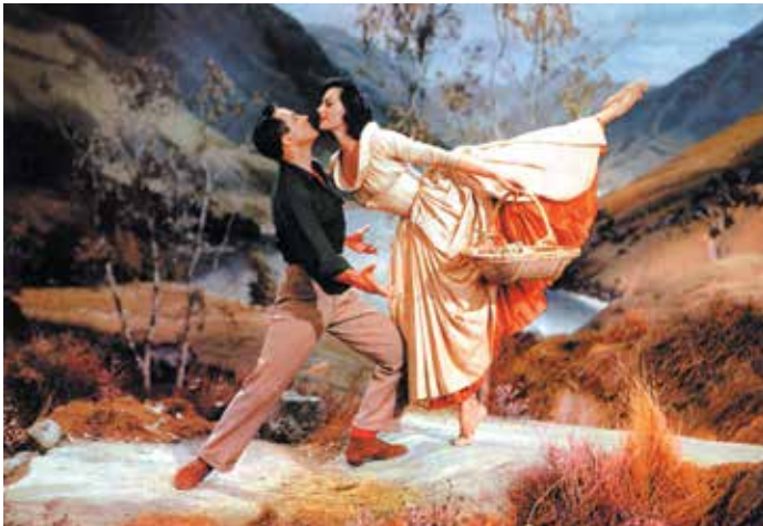
Gene Kelly et Cyd Charisse dans Brigadoon de Vincente Minnelli