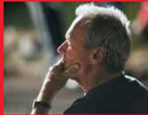
Clint Eastwood

L'heure de la soirée sera annoncée sur le site internet du festival www.lumiere2009.org