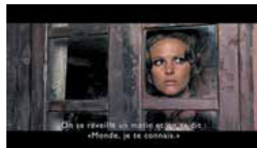
Claudia Cardinale dans l'étair une fois dans l'Ouest de Sergio Leone

Sur les grilles de l'Hôtel du Département (cours de la Liberté, Lyon 3 ème ), cette exposition en accès libre est consacrée aux westerns de Sergio Leone. Issus directement des films, les photogrammes font la part belle aux icônes de légende (Clint Eastwood, Charles Bronson, James Coburn, Henry Fonda...), mettant en valeur le sens du cadre, le graphisme, les paysages désolés et les répliques qui ont fait le style unique de Sergio Leone.