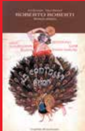
Affiche originale italienne de La Contessa Sara de Roberto Roberti

11h30 La Contessa Sara de Roberto Roberti ( La Contessa Sara , 1919, 1h08) Accompagnement musical : Conservatoire de Lyon