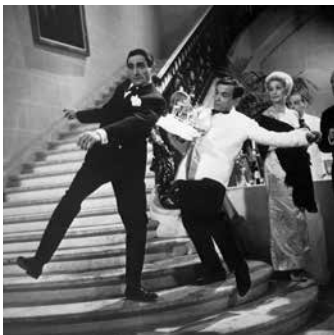
Yoyo de Pierre Etaix