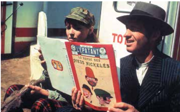
Anna Karina et Jean-Paul Belmondo dans Pierrot le fou de Jean-Luc Godard