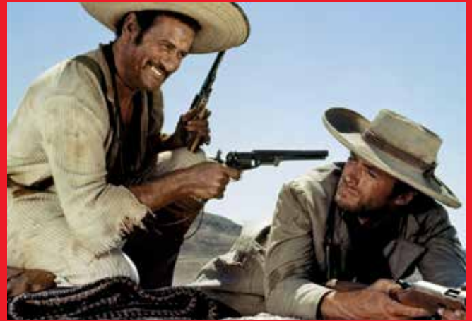
Eli Wallach et Clint Eastwood dans Le Bon, la brute et le truand de Sergio Leone